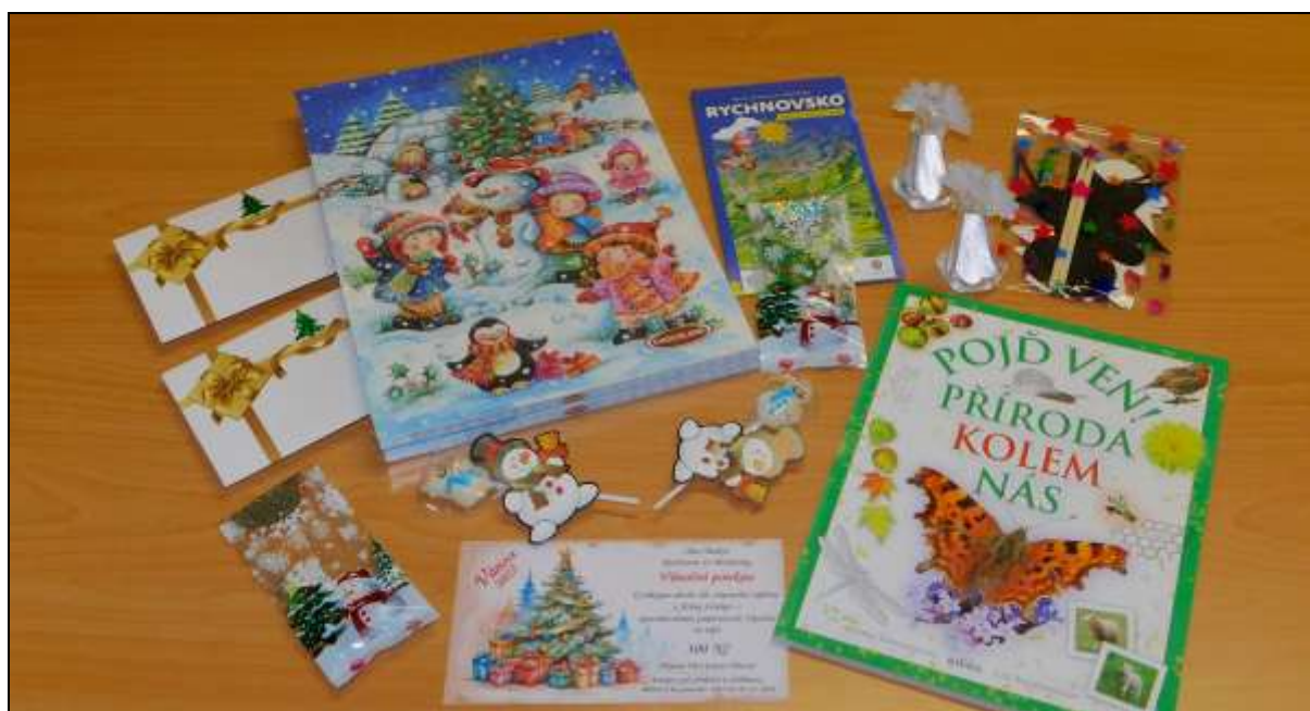
Dárky pro děti