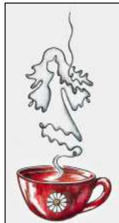
Dětská knihovna a zázemí Čajovna u bludičky, nové logo