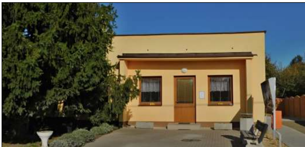
Společenský a přednáškový klub

Besedy, výstavy, přednášky, vyhodnocení soutěží, setkání seniorů, výtvarné kurzy pro větší počet osob, společenské akce (až 60 osob) Je zde perfektní zázemí (větší sál, kuchyňka s menším sálem, výstavní prostory).