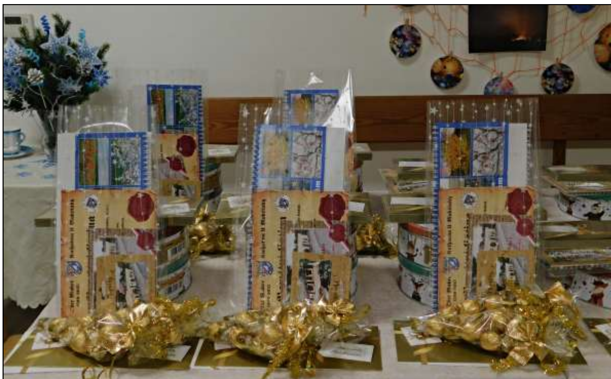
Dárky pro seniory

V knihovně se tradičně připravují vánoční dárky pro děti do 15 let a seniorům nad 70 let.