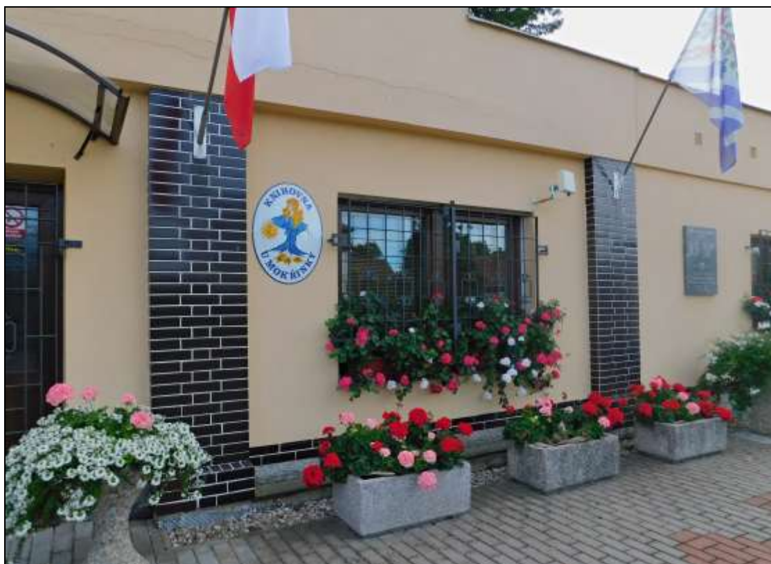
Knihovna U Mokřinky, čp. 12