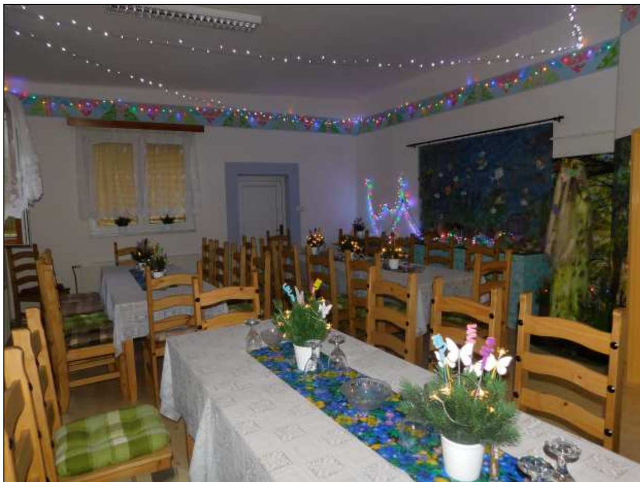
Společenský a přednáškový sál čp. 88