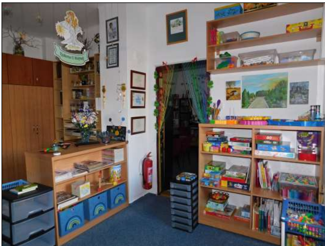
Dětský koutek, hračky a hry pro děti, na skříňky a boxy přispěl Královéhradecký kraj